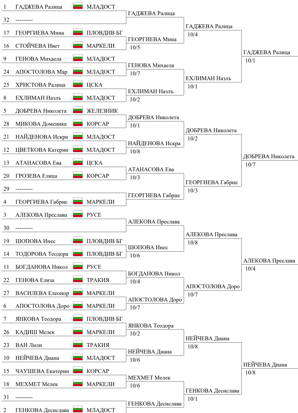
Tableau of 8