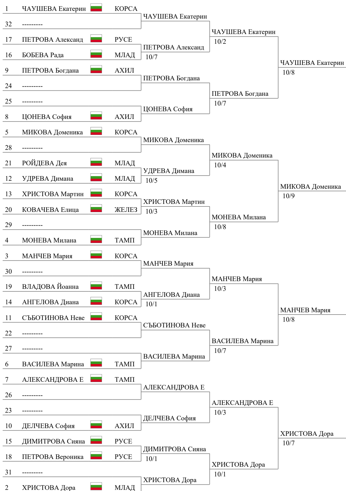
Tableau of 8